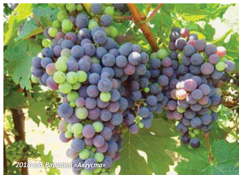
2018 год. Вариант «Августа»

к двум разным химическим классам и отличаются по механизму действия. Поэтому Борей Нео обладает высокой скоростью действия и длительным периодом защиты. Он высокоэффективен против гроздевой листовертки в норме расхода 0,1 - 0,2 л/га.