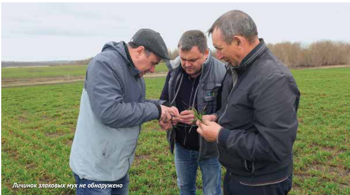
Личинок злаковых мух не обнаружено