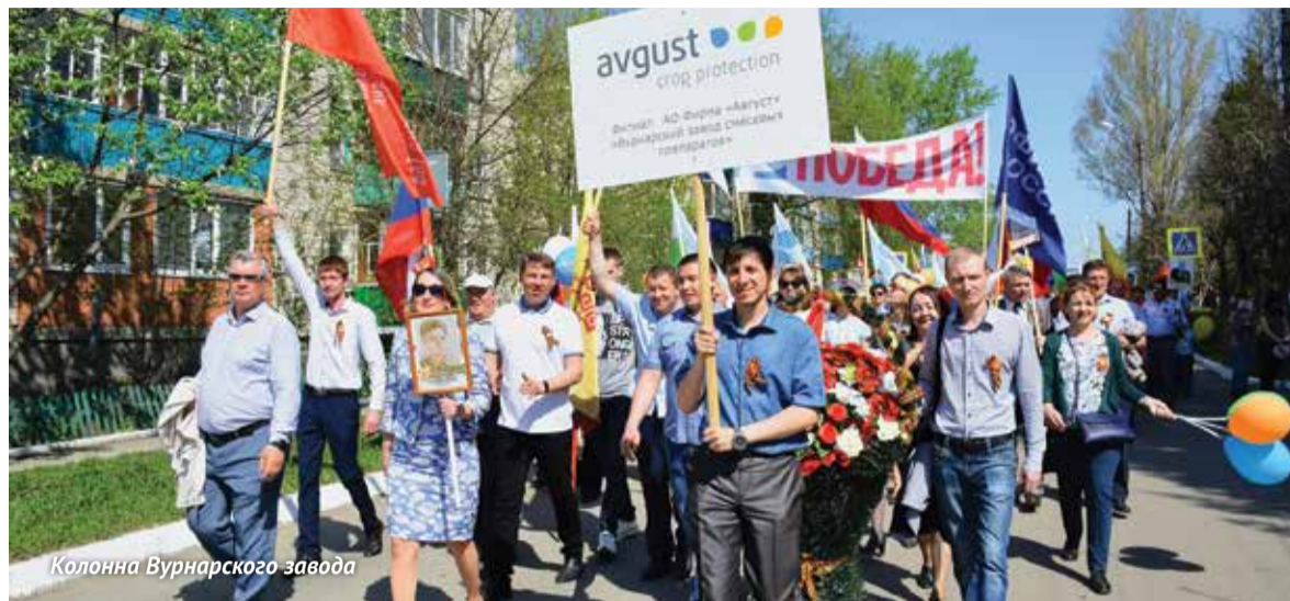
Колонна Вурнарского завода