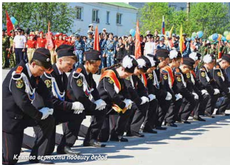
Клятва верности подвигу дедов

В день 74-й годовщины Победы советского народа в Великой Отечественной войне коллектив завода компании «Август» в чувашском поселке Вурнары прибыл на торжественный митинг многочисленной, ярко украшенной колонной.