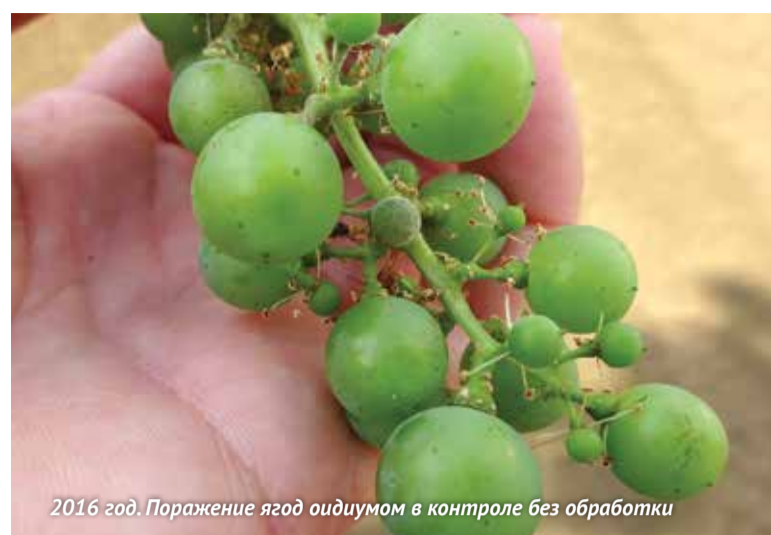
2016 год. Поражение ягод оидиумом в контроле без обработки

В 2019 году компания «Август» зарегистрировала для применения на виноградниках инсектицид Борей Нео. Это трехкомпонентный препарат на основе альфа-циперметрина, 125 г/л, имдаклоприда, 100 г/л и клотианидина, 50 г/л. Три действующих вещества относятся