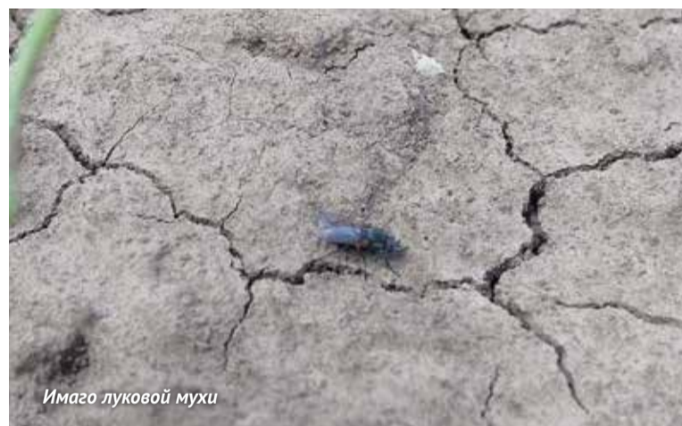
Имаго луковой мухи

ся. В опытах хорошо себя показали инсектицид Энлиль в смеси с препаратом Герольд (препараты пока не зарегистрированы к применению на луке – прим. ред.). Из-за действия Герольда – ингибитора синтеза хитина – личинки либо вообще не отрождаются из отложенных на почву яиц, либо погибают вскоре после появления. А диазинон (действующее вещество инсектицида Энлиль) ложится на почву сверху, держится на ней не менее семи дней и контактно действует