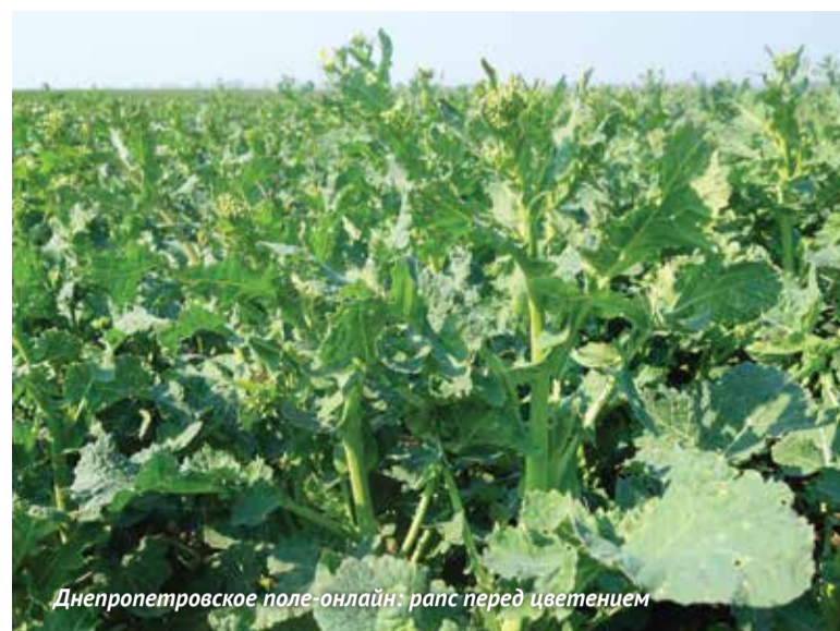
Днепропетровское поле-онлайн: рапс перед цветением

В мае в проекте появились первые репортажи специалистов «Августа» с картофельных полей: из