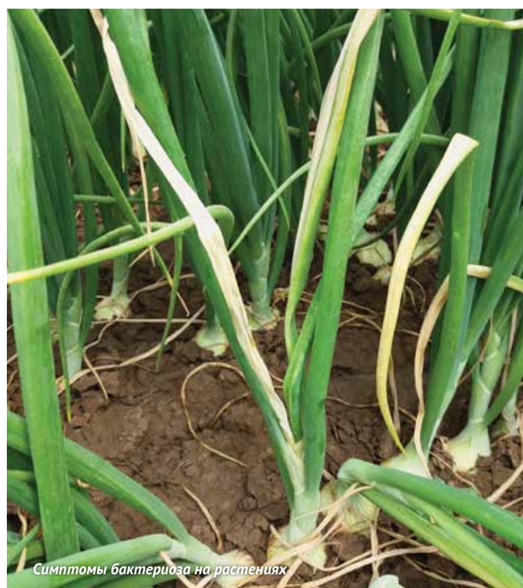
Симптомы бактериоза на растениях

на выживших личинок во время их перемещения к растениям. Так как в начале сезона погода у нас переменчива, то лёт мухи растянут по времени и проходит волнообразно. Поэтому приходится делать до трех таких обработок, зато они дают хорошие результаты.