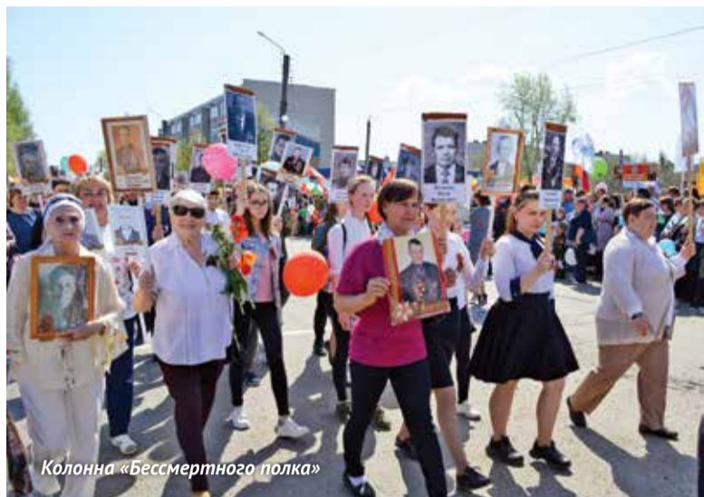
Колонна «Бессмертного полка»