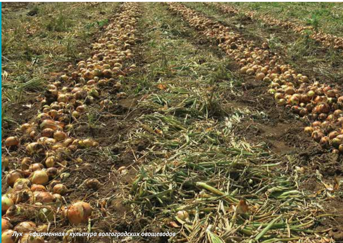
Лук – «фирменная» культура волгоградских овощеводов