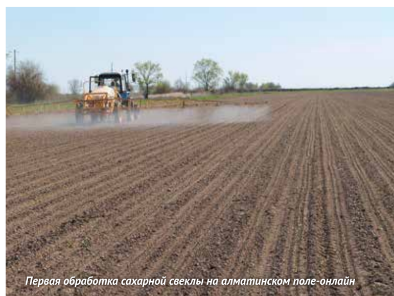
Первая обработка сахарной свеклы на алматинском поле-онлайн

Казахстана и Иркутской области России. В хозяйствах используют картофелесажалку «Grimme», которая за один проход выполняет фрезерование, внесение удобрений, протравливание клубней, сажает и нарезает гребни. В КХ «Жана талап» (Жамбылская область, Казахстан) для протравливания семян применили системный инсектицид Табу, 0,3 л/л и фунгицидный протравитель ТМТД ВСК, 4 л/л.