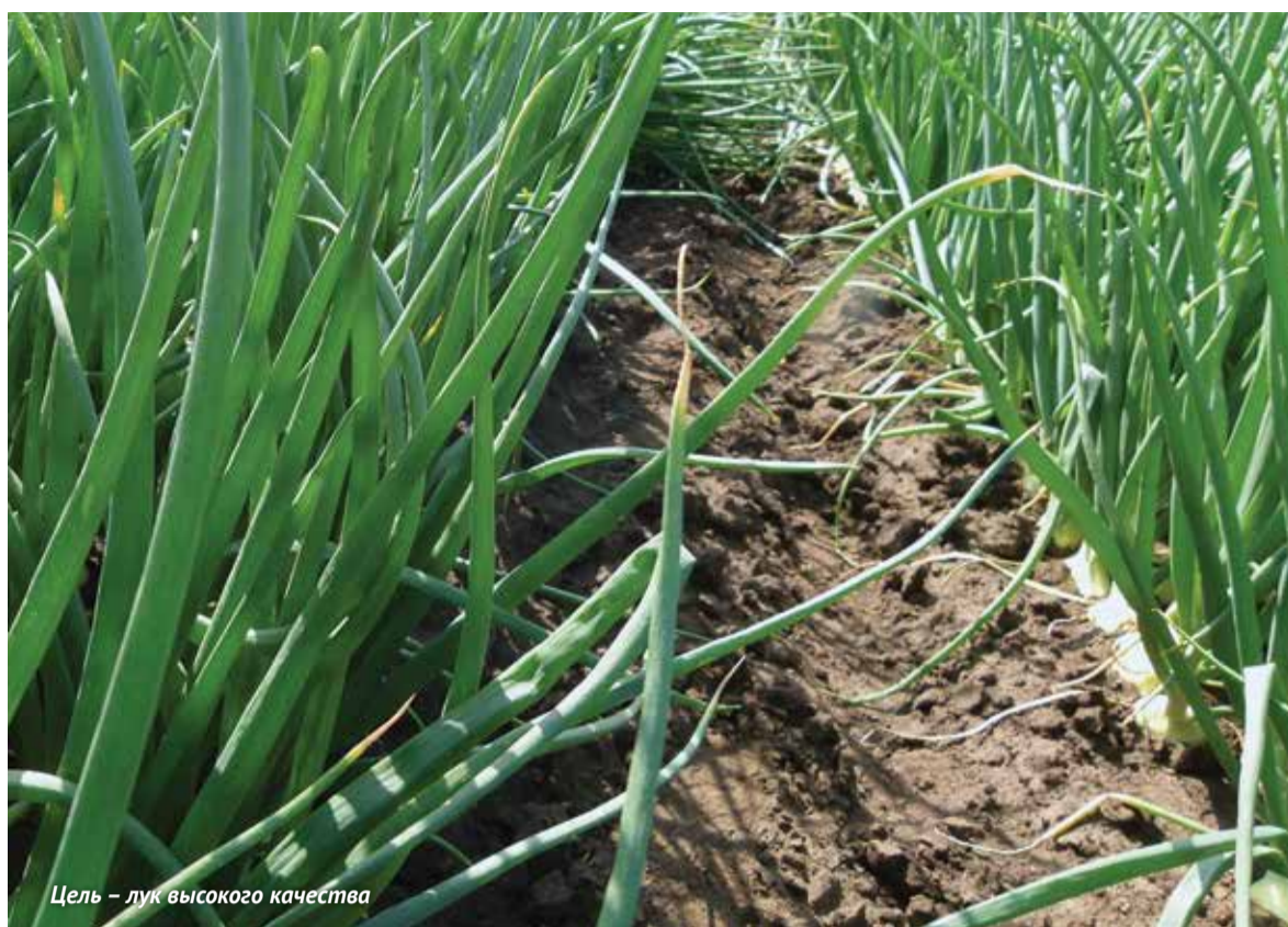
Цель – лук высокого качества

Несмотря на наши региональные хозяйственные особенности (высокая насыщенность культурами, отсутствие пространственной изоляции), нужно стараться выдерживать севообороты и вводить в них пары, желательны занятые сидератами.