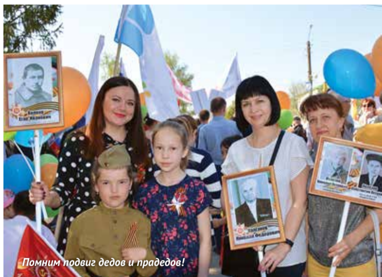
Помним подвиг дедов и прадедов!