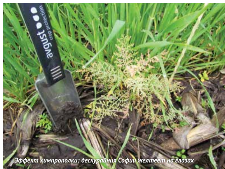
Эффект химпрополки: дескурайния Софии желтеет на глазах