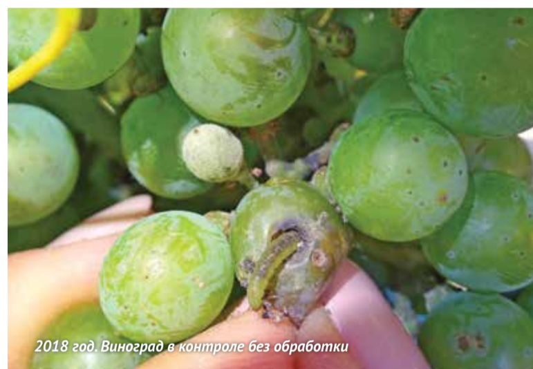
2018 год. Виноград в контроле без обработки