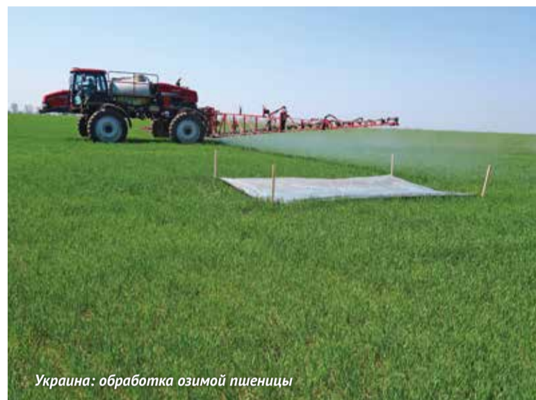
Украина: обработка озимой пшеницы