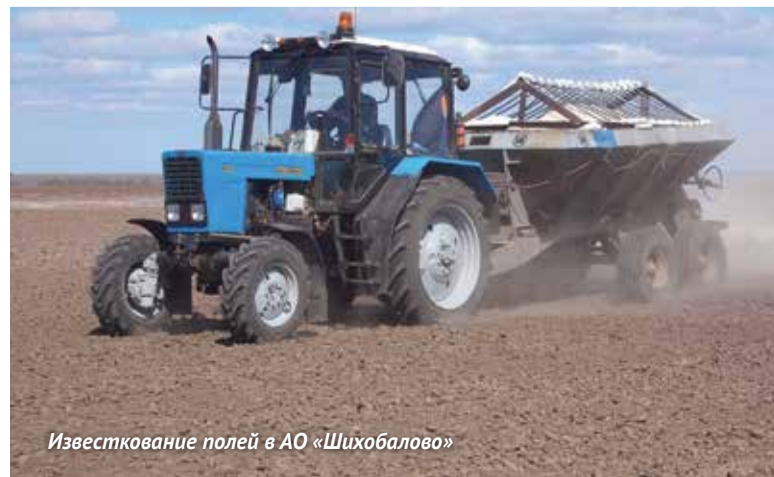
Известкование полей в АО «Шихобалово»