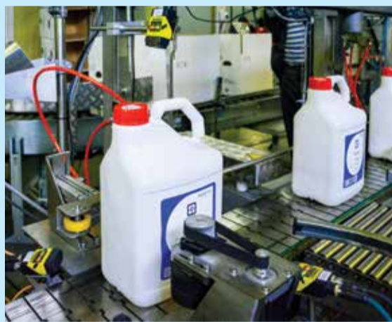
Печать DataMatrix-кода (DM-кода) на этикетке канистры

Упрощает складской учет для потребителей. Крупные клиенты