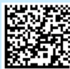
DataMatrix-код, в котором зашифрованы: - код товара GTIN - серийный номер - дата производства - номер партии - дата окончания срока годности