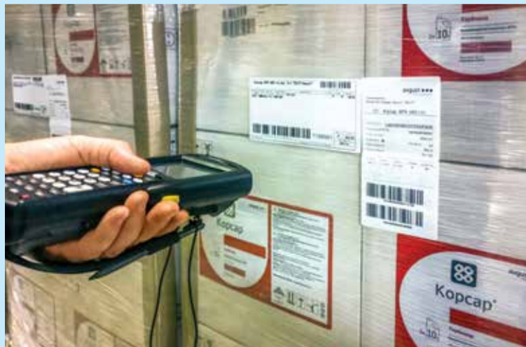
Палетный ярлык с кодом транспортной упаковки (SSCC) из 18 цифр в читаемом виде и в виде линейного штрих-кода. Содержит индивидуальный серийный номер транспортного пакета, включающий информацию о содержащихся в нем коробах и соответствующий линейный штрих-код

Продукция (GTIN): 04606696006393 Фасовок: 12 СКТУ (SSCC): 046066960007463312