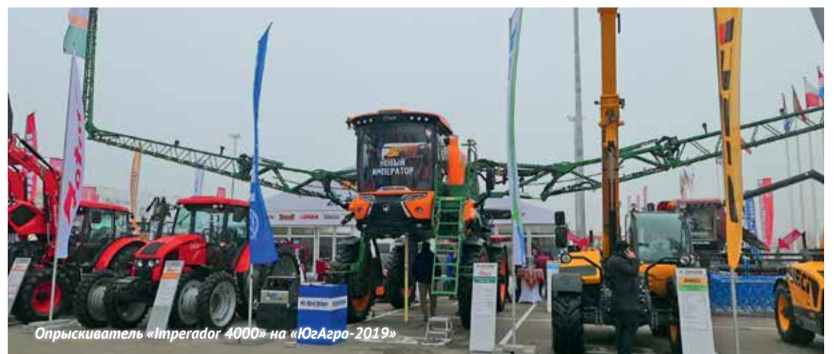
Опрыскиватель «Imperador 4000» на «ЮгАгро-2019»

Машина оснащена немецким турбодвигателем «Cummins» мощ-