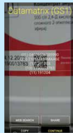
Scanner - расшифровка DM-кода