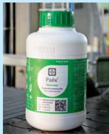
Банка с DM-кодом