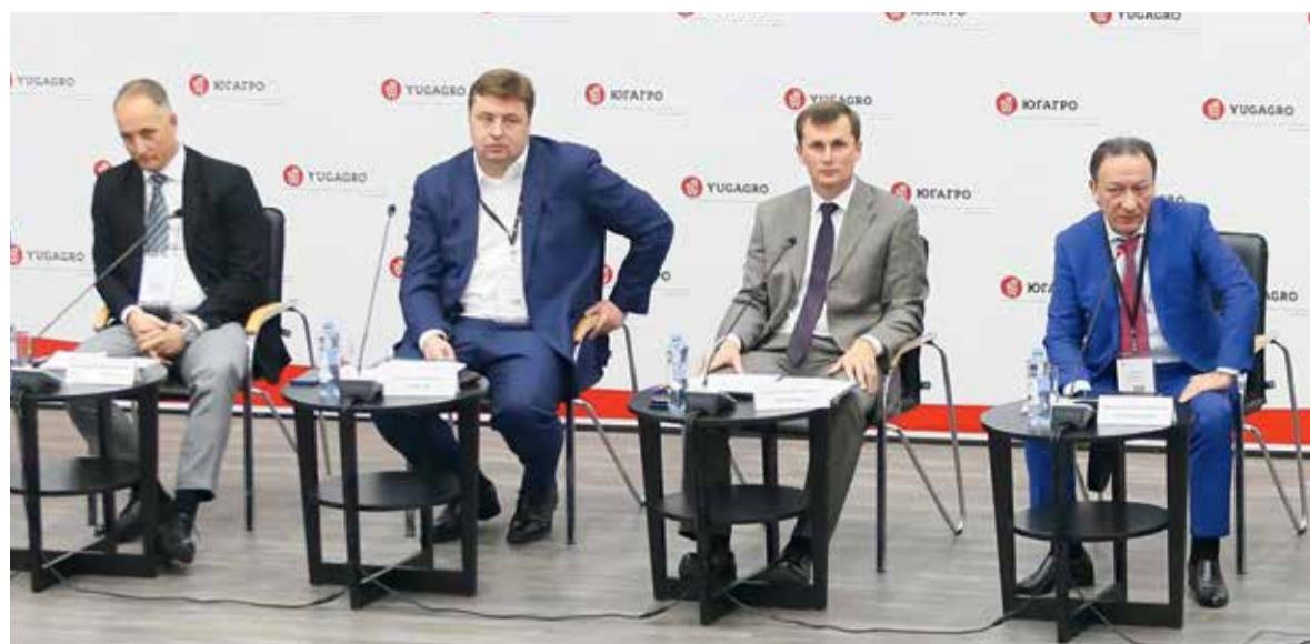
В президиуме пленарного заседания

Деловая программа 26-й международной выставки «ЮгАгро-2019», прошедшей в Краснодаре 19-22 ноября 2019 года, открылась пленарным заседанием «Защита агробизнеса: проблемы и пути решения». Оно было посвящено вопросам федеральной поддержки экспорта продовольствия и сельхозсырья, развитию АПК РФ и взаимодействию органов госвласти с агрохолдингами с целью увеличения агроэкспорта и выхода отечественных производителей на мировой рынок продовольствия.