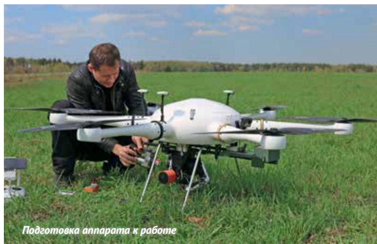
Подготовка аппарата к работе

В нашей производственной линейке две модели агродронов: один рассчитан на 5 л рабочего раствора, а второй – на 10 л, их приблизительная стоимость сейчас соответственно 300 и 500 тыс. руб. Для большинства задач оптимальна «десятка»: один полет – это 8 - 10 мин., и обычно за это время расходуется 10 л раствора на 1 га и разряжается один комплект батарей. У каждого дрона есть четыре запасных комплекта, а время зарядки каждого – 50 - 60 мин. Когда первый комплект отработал, мы меняем его на другой, а этот ставим на зарядку. К тому моменту, пока израсходуются все четыре, «стартовый» уже зарядится, и таким образом можно обеспечить непрерывную работу.