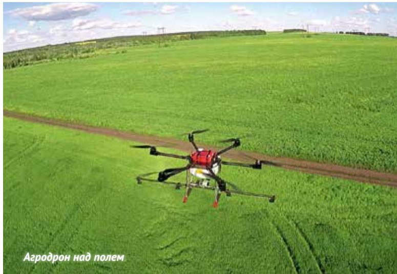
Агродрон над полем