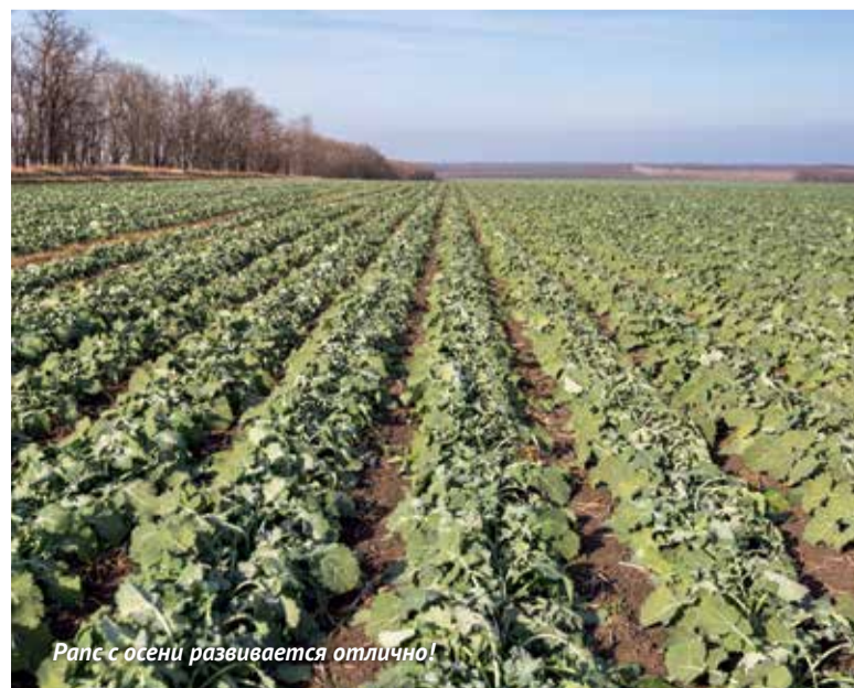
Рапс с осени развивается отлично!

Мы сами эту проблему никак не можем решить. Вот сейчас сахар подешевел в опте до 18 руб/кг, и вы-