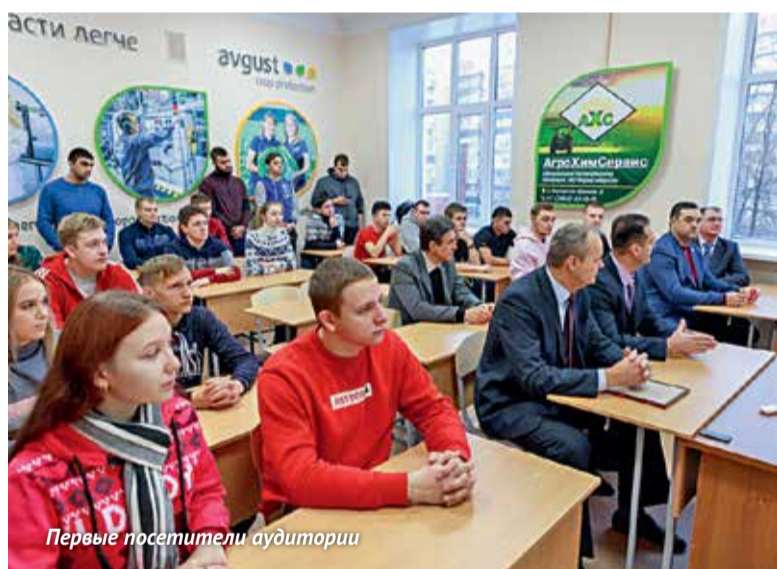
Первые посетители аудитории