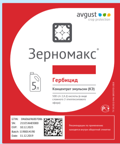
Этикетка на канистру с необходимой информацией