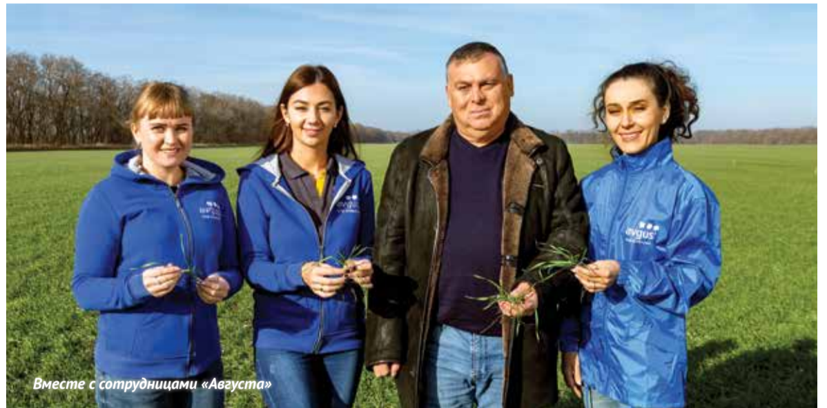
Вместе с сотрудницами «Августа»

Прежде всего – выполняем хорошую, идеальную подготовку полей