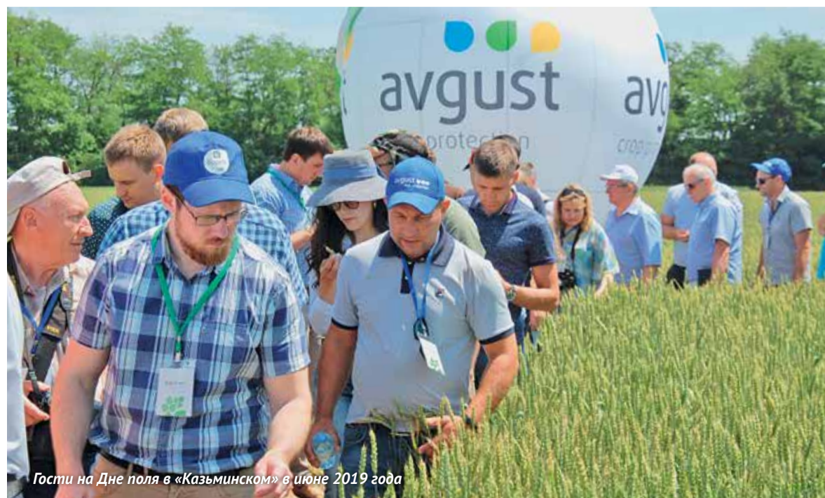
Гости на Дне поля в «Казьминском» в июне 2019 года

Беседу вела Ольга РУБИЦА, над материалом работали Виктор ПИНЕГИН и Людмила МАКАРОВА