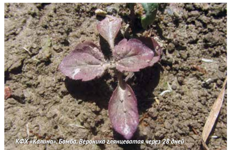
КФХ «Калина». Бомба. Вероника глянцеватая через 28 дней

В КФХ «Калина» Калининградской области Балерину Супер, 0,4 л/га применили на яровой пшенице 27 мая. Позже (12 июня) посева обработали гербицидом Бомба, 30 г/га + ПАВ Адыо, 0,15 л/га против вероники глянцеватой, а также 15 июня – граминицидом Ластик Экстра, 1 л/га против злаковых сорняков. Уже через два дня после использования Балерины Супер отмечалось увядание двудоль-