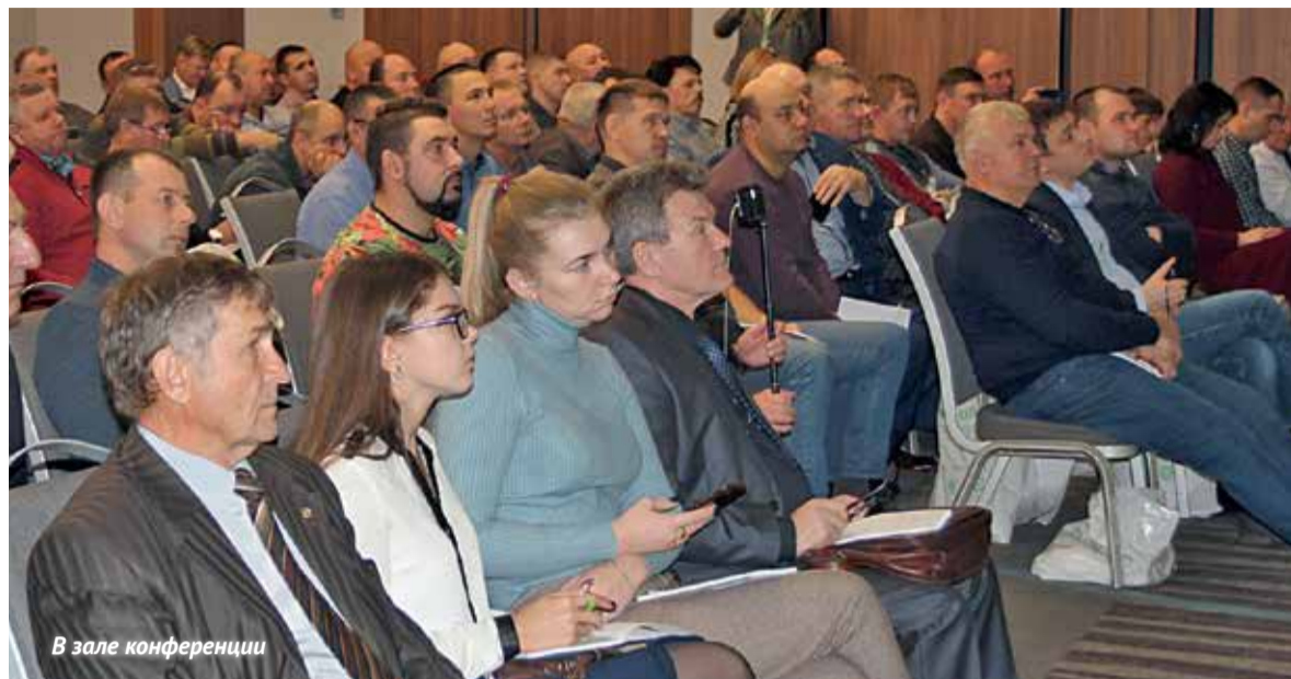
В зале конференции

Компании «Август» и «Аграрум» в рамках выставки «ЮгАгро-2019» в Краснодаре провели научно-практическую конференцию по технологии No-till. О том, насколько велик интерес к этой теме, говорит тот факт, что в ней приняли участие более 120 человек из самых разных регионов России. Среди них были и те, кто приехал за знаниями, и те, кому уже есть чем поделиться с коллегами.