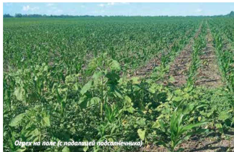
Орех на поле (с падалицей подсолнечника)

С. Н. Хворостяной: Я в некоторых хозяйствах видел некачественный сев – не получаются дружные всходы, и из пяти растений на 1 м 2 одно или два заметно отстают в развитии. И когда начинают химобработку, получается, что у одного растения два листа, а у другого – пять. Те, что стартуют первыми, начинают угнетать слабые, но эти слабые все равно