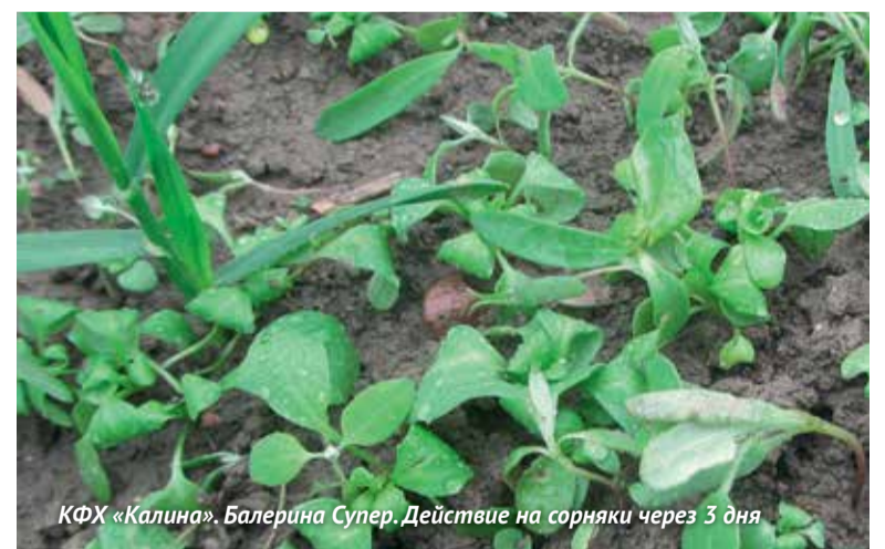
КФХ «Калина». Балерина Супер. Действие на сорняки через 3 дня