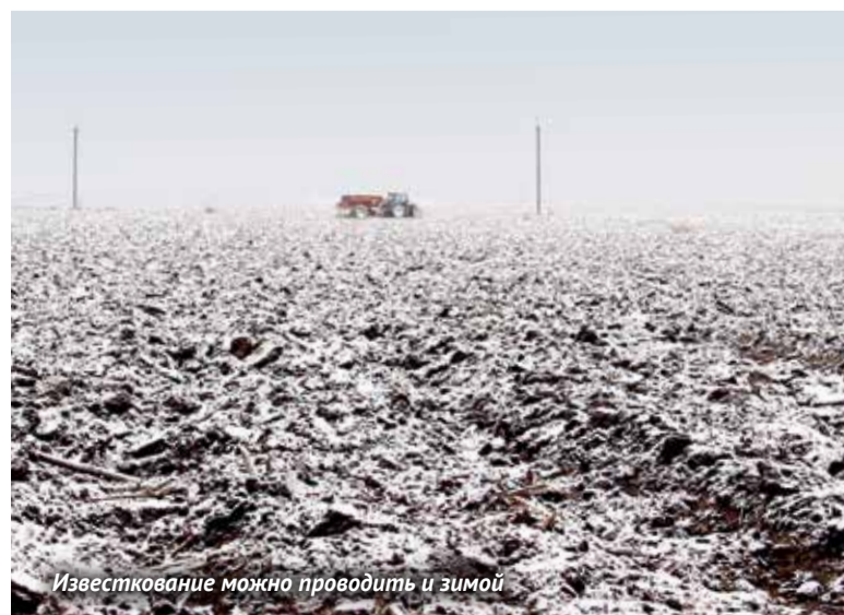
Известкование можно проводить и зимой