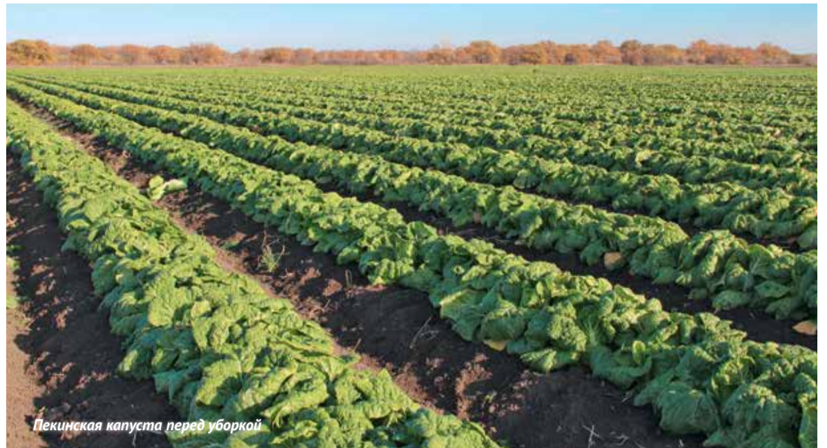
Пекинская капуста перед уборкой

Если обозначать впечатления одним словом, то – удобно! Мы же выращиваем большой набор разнообразных культур, и жизнь часто «подкидывает» нам новые задачи. Как только не можем найти ре-