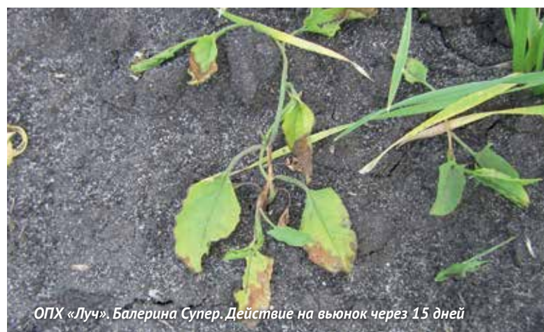
ОПХ «Луч». Балерина Супер. Действие на вьюнок через 15 дней

ных сорняков по сравнению с контролем без обработки, где исходная масса сорных растений составляла 350 г/м 2 .