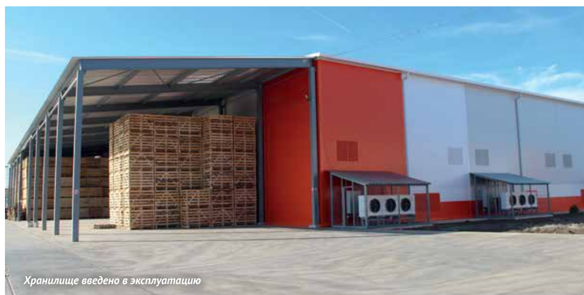
Хранилище введено в эксплуатацию

Лук сеем в феврале. Как только семена наклюнутся – расставляем кассеты и выращиваем около 1,5 месяцев, до четырех - пяти листьев. К этому времени уже и луковица намечается. В первых числах апреля, как только земля доходит в поле до физической спелости, растягиваем капельную ленту, да и все поливное оборудование подготавливаем, после чего высаживаем рассаду.