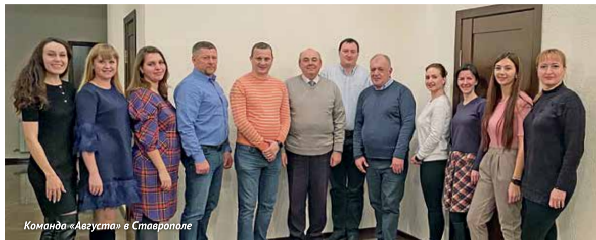
Команда «Августа» в Ставрополе

Осенью прошлого года отметило 25-летие самое крупное и успешное из 60 региональных представительств компании «Август» – Ставропольское (с офисами в Ставрополе и селе Кочубеевское). Оно прошло впечатляющий путь развития, отработало в своей практике много приемов работы с клиентами, которые берут «на вооружение» другие «августовские» коллективы в регионах России.